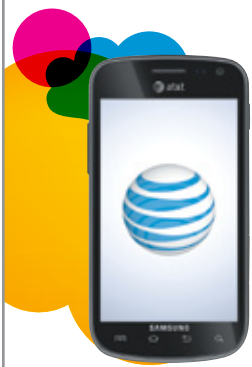
SAMSUNG GALAXY EXHILARATE™ i577

*Contact data synced to your phone may vary when data entered at the AT&T Address Book website exceeds the number of fields supported on this phone.